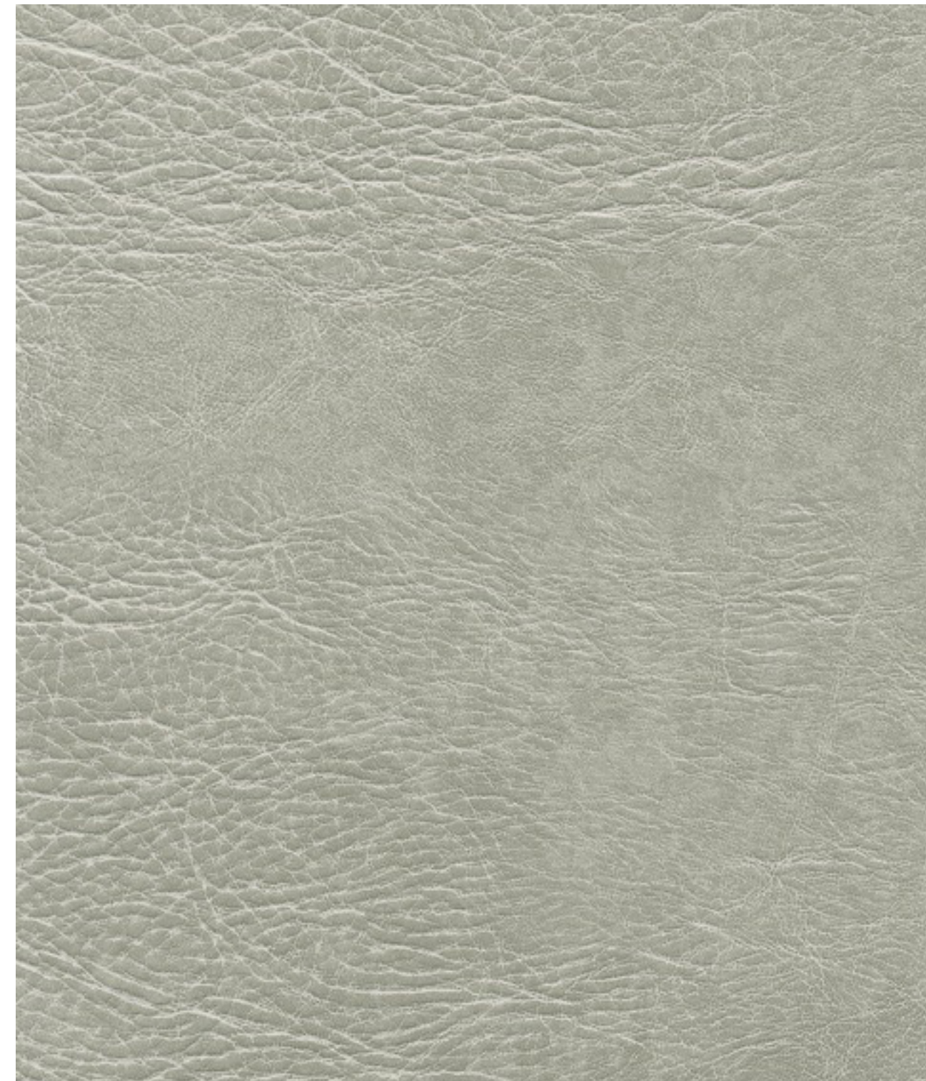
skai® Pavinto lightgrey F6411233

El producto para tapizado de alta calidad skai® Pavinto está dotado de una estética de cuero vacuno que imita los roces de un uso intenso. Sus roturas y desgastes visuales, pero también su grano variado, contribuyen a la autenticidad de este look vintage.