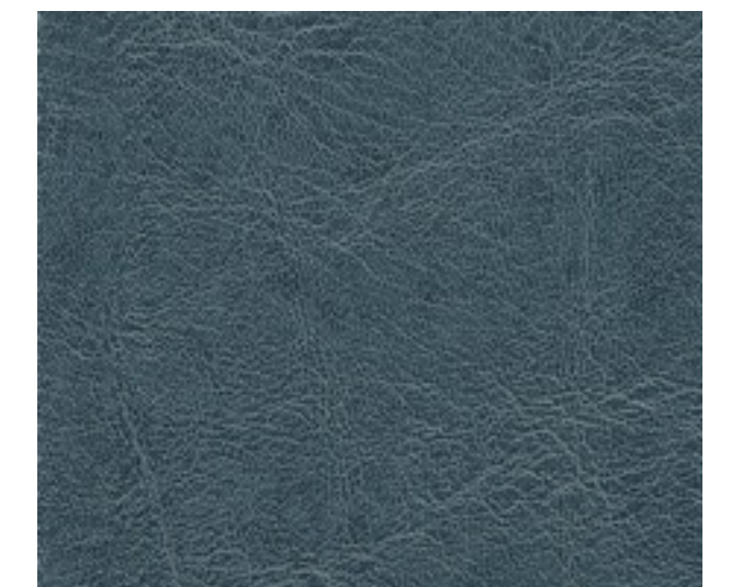
sea blue F6411232